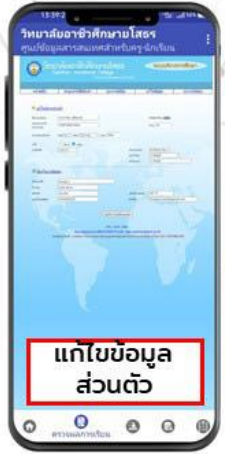
แก้ไขข้อมูลส่วนตัว