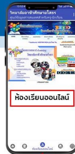
ห้องเรียนออนไลน์