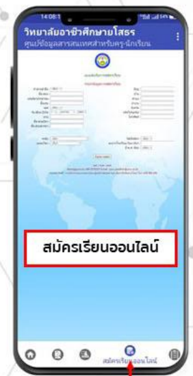
สมัครเรียนออนไลน์

ระบบสมัครเรียนแบบออนไลน์ เป็นอีกช่องทางหนึ่งที่อำนวยความสะดวกให้แก่ผู้ที่สนใจสมัครเรียนโดยไม่ต้องเดินทางมาสมัครที่วิทยาลัยโดยตรง แต่สามารถสมัครผ่านหน้าเว็บไซต์วิทยาลัยได้เลย