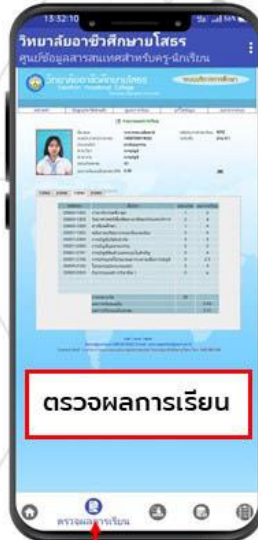
ตรวจผลการเรียน