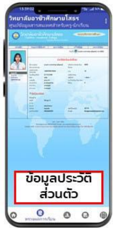
ข้อมูลประวัติส่วนตัว

นักเรียน-นักศึกษาสามารถดูผลการเรียนตั้งแต่ได้ จากเมนู "ตรวจผลการเรียน" ระบบจะทำการแสดงรายวิชา ต่าง ๆ พร้อมทั้งผลการเรียนที่นักเรียน-นักศึกษาได้เรียนมา ตั้งแต่อดีตจนถึงปัจจุบัน และยังสามารถดู ข้อมูลประวัติ ส่วนตัว แก้ไขข้อมูลส่วนตัวได้อีกด้วย