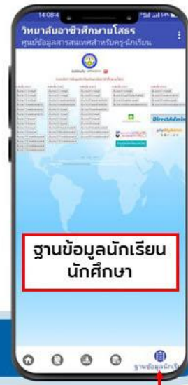
ฐานข้อมูลนักเรียนนักศึกษา